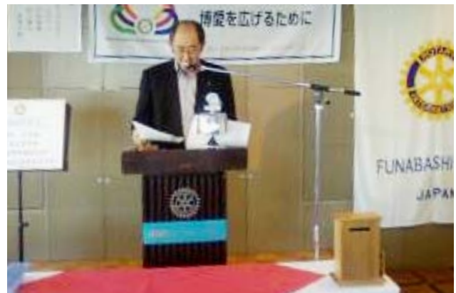
卓話する遠田会員